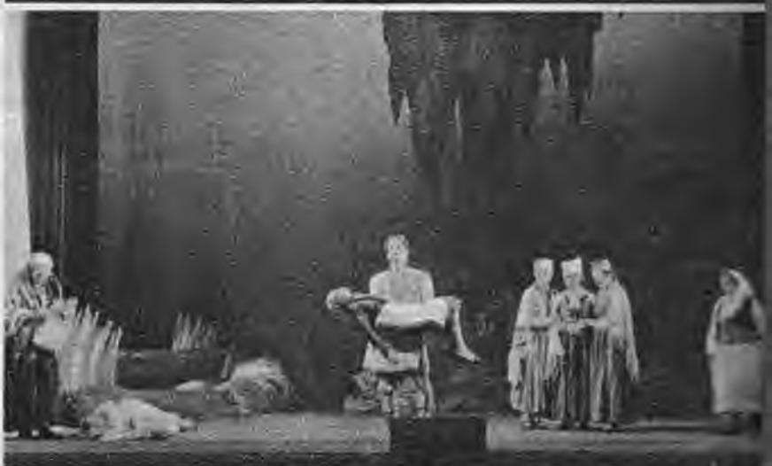
J. Raiņa „Pūt, vējipi” aina.