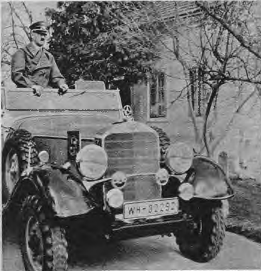
Vadonis 1938. gada vēsturiskās marta dienās, kad bija kritusi robeža starp Vāciju un Austriju, braucienā uz dzimteni savu vecāku namu priekšā Leondingā pie Lincaus.

Nacionālsociālistiskās Vācijas vēstures gaitā marta mēnesis ir kļuvis sevišķi nozīmīgs. 1933. gadā šai mēnesī Adolfs Hitlers kā valsts kanciers pirmoreiz galīgi uzvarēja vēlēšanu cīņās, 1935. gada martā ārpusauli pārsteidza vispārējās karaklausības izsludināšana, vēl pēc gada vācu karavīri atkal ieņēma Reinzemē, 1939. gadā nodibināja reichsprotektorātu Bohēmijā un Morāvijā.