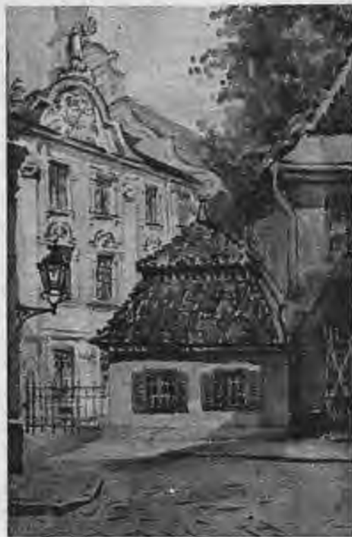
Z. Tālberga — Jounā iela Rīgā.