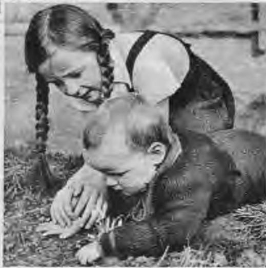
Lūk, kur pirmā vizbulīte! Arī darba vīriem patīk saule.

Nevar gan diemžēl apgalvot, ka mēs, pēc sena paraduma, pavasarī būtu sagaidījuši vakaros kaimiņā gavilējoči. Mūsu laikos gavilēšana sīkstāj gaušanās par pārpildītiem tramvajiem un kīno bilšu iegādes grūtībām, lai gan citādi mēs labprāt atceramies