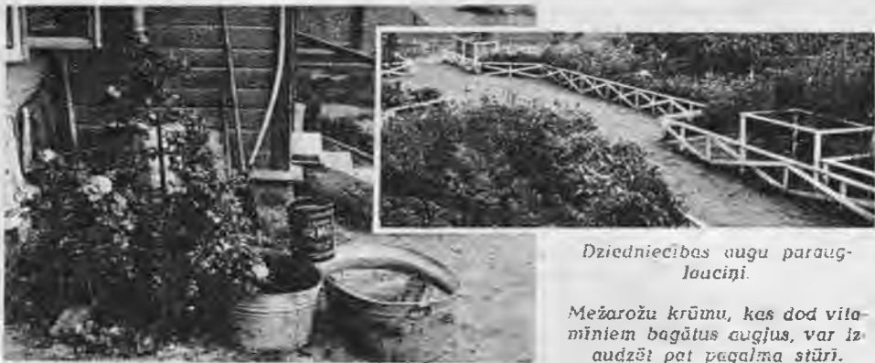
Dziedniecības augu parauglaciņi.