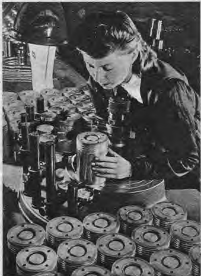
Šai izšķirīgajā brīdī ikvienam jānāk talkā! Tagad jāatsakās no mietpilsoniskām ērtībām, no visām privātām, egoistiskām prasībām un jāvēlta visi spēki totālā kara vajadzībām.