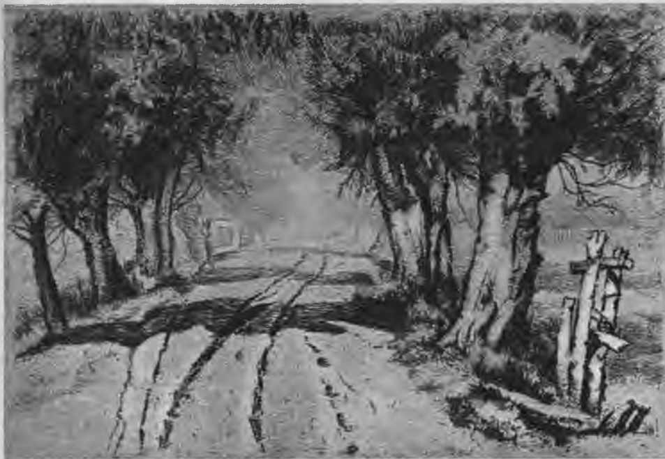
Z. Tālberga — Saulainais ceļš.